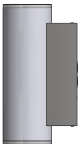
ErikLED Art.Nr. 555-4xx

De lamp is geproduceerd met de grootst mogelijke aandacht voor de bescherming van zowel de zorgende omgeving als de werkomgeving. Als ze er uiteindelijk voor kiezen hun lamp te vervangen, moeten ze ervoor zorgen dat deze wordt teruggestuurd voor recycling. De verpakkingen zijn, voor zover mogelijk, gerecyclede materialen, die zij dienen in te leveren voor recycling.