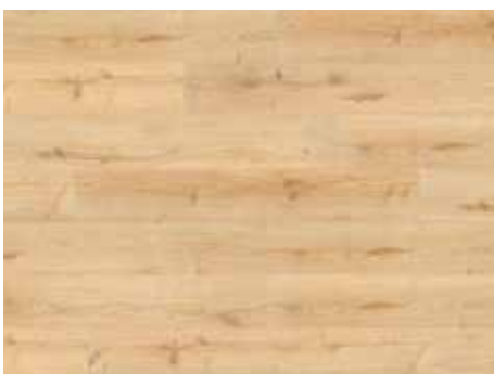
Garden Oak Varenr. 10200214