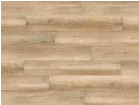
Calistoga Cream Varenr. 10200211