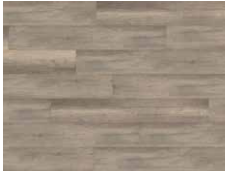
Calistoga Grey Varenr. 10200212