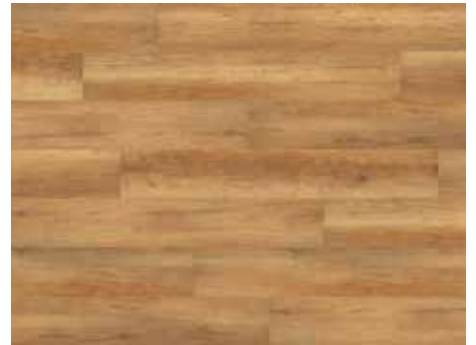
Calistoga Nature Varenr. 10200213