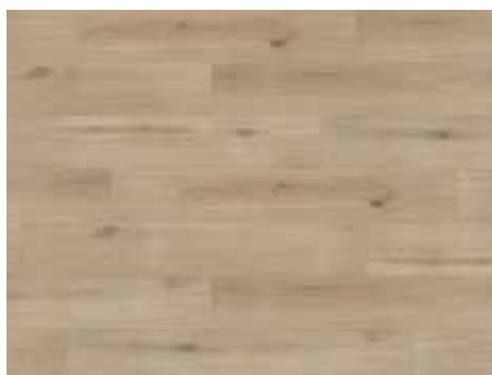
Island Oak Sand Varenr. 10200215