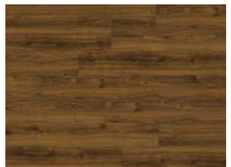
Dakota Oak Varenr. 10200216